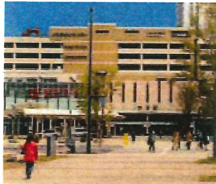
JR大分駅・アミュプラザおおいた