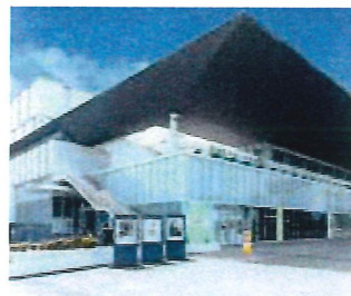
ホルトホール大分