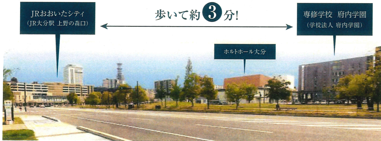
JR大分駅・上野の森口周辺(大分銀行宗麟館前より)