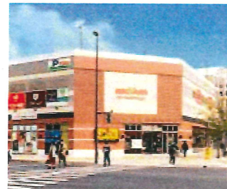
KCAアクロスプラザ大分駅南