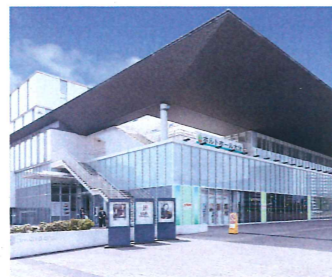
J:COM ホルトホール大分