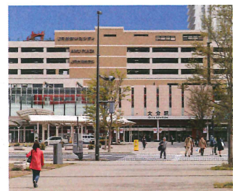
JR大分駅・アミュプラザおおいた