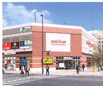
KCAアクロスプラザ大分駅南