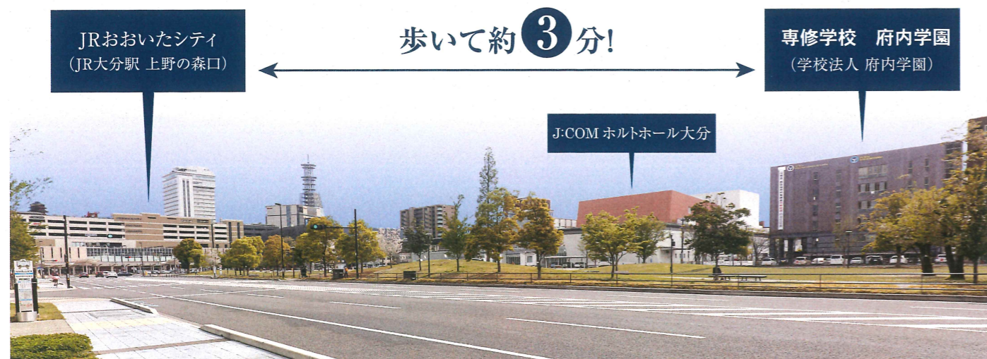
JR大分駅・上野の森口周辺(大分銀行宗麟館前より)