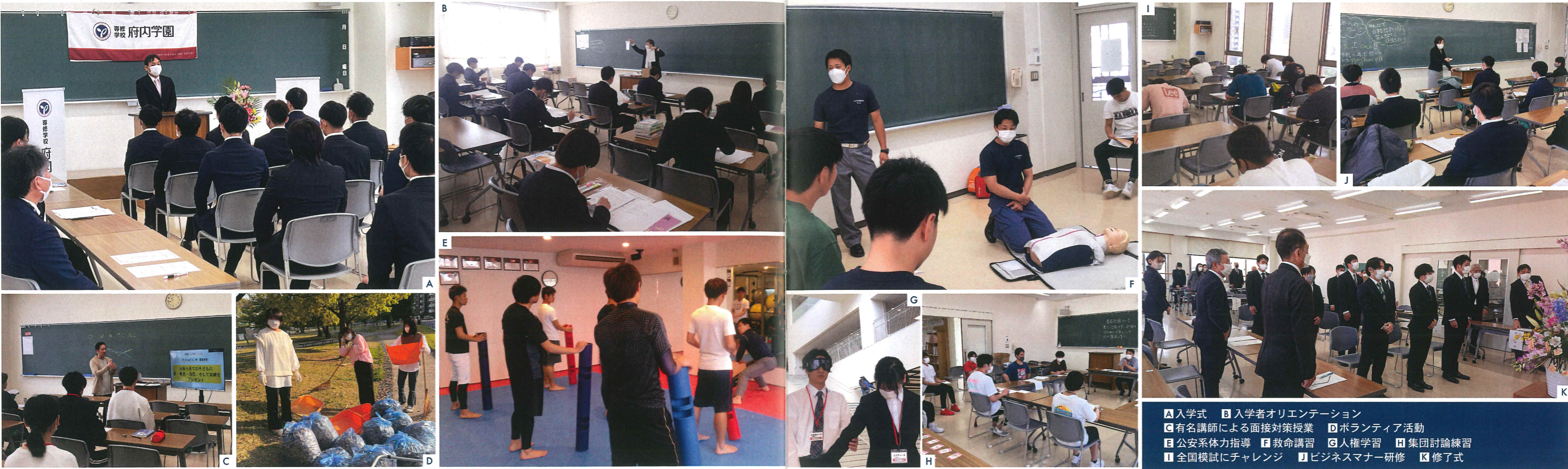
A 入学式 B 入学者オリエンテーション C 有名講師による面接対策授業 D ボランティア活動 E 公安系体力指導 F 救命講習 G 人権学習 H 集団討論練習 I 全国模試にチャレンジ J ビジネスマナー研修 K 修了式